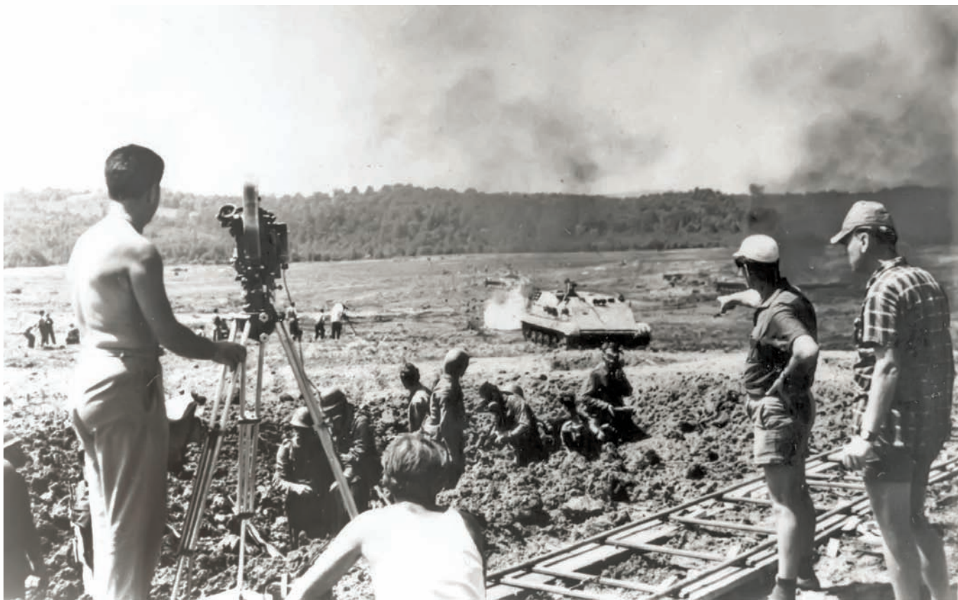
Са снимања серија „Војници”