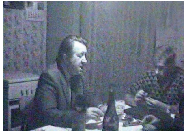
Мартин Шпегељ, припреме за рат

С друге стране, технолошке промене у „Застави“ биле су на добром нивоу. Опремање видео-продукцијом показало се као кључно за опстанак куће јер је обезбедило знатну предност у односу на друге продукцијске куће у окружењу. Управо зато су многе установе биле додатно заинтересоване за сарадњу са „Заставом“. Скупи пројектори више нису били потребни, као ни кинооператери, а комплетан процес израде филмова је појеф-