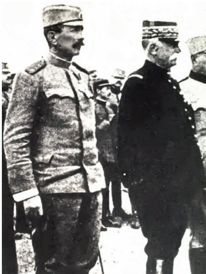
Војвода Петар Бојовић и Морис Сарај на Солунском фронту 1916. године