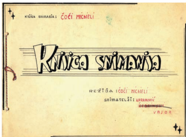
Прва књига снимања

★ Према сценарију мајора Марјана Маринца започет је рад на кратком документарном филму „Чедо народне револуције“, који обрађује услове под којима је стварана наша Армија и њен пут борбе и развика. Екипа на челу са редитељем мајором Марјаном Маринцем, труди се да филм заврши до Дана Југословенске армије, како би се овај први документарни филм „Застава филма“ могао дати већ тога дана. Сниматељ филма је Марјан Вајда.