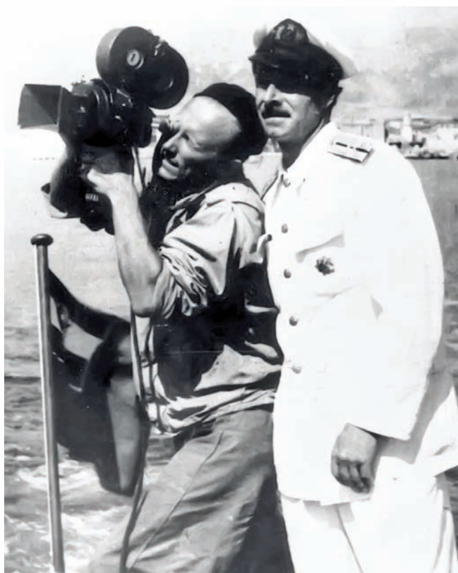
Снимање репортаже о Ратној морнарици