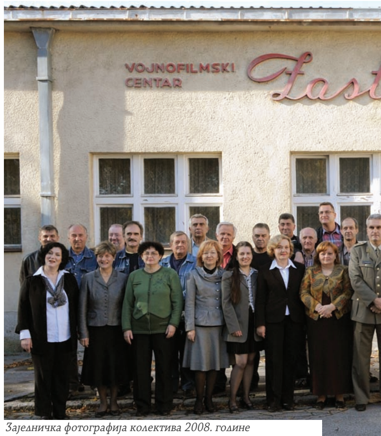
Заједничка фотографија колектива 2008. године

ситуација се заоштрава, а догађаји убрзавају, па рад „Заставе” постаје потпуно документарни. Поред филма о илегалном наоружавању и припремању рата, ВФЦ је, како се наводи у књизи о историји ове куће, урадио много емисија и прилога о ратним дејствима. Реализоване су десетине документарних филмова, емисија и прилога. Међу најважнијим су: