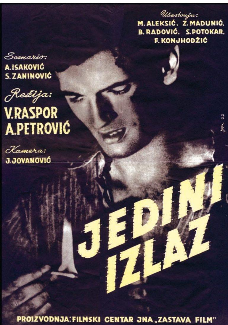
Први „Заставин” играни филм