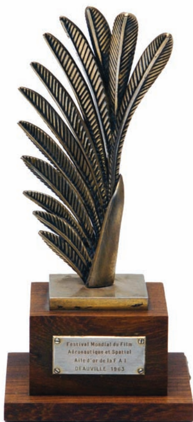
„Златно крило“, Довил, Француска 1963. године