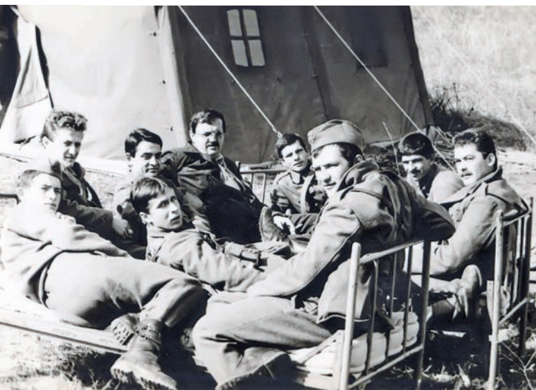
Екипа ТВ серије „Војници“

тити јавност да су жене борци увек биле део традиције југословенских народа, па је филм „Прва генерација“ једно од остварења која су обележила ту годину. Те године „Застава“ је у копродукцији са ТВ Скопље почела да ради и на једном веома занимљивом филму, који се бавио бугарским партизанским одредом „Христо Ботев“, који је у прво време подржавао бугарску окупацију делова Југославије, да би обавештајним радом македонских комуниста прешао на страну партизана.