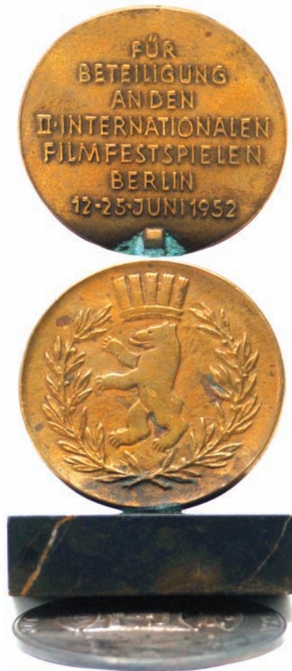
Награда са међународног фестивала у Берлину 1952. године

Између 1950. и 1954. године „Застава“ је снимила чак 49 документарних филмова, углавном пропагандних. Један од њих, „На граници Југославије“, донео је и прву међународну награду, 1952. године у Берлину. Био је то само почетак неколико деценија успешних наступа и рада који је донео многе пло-