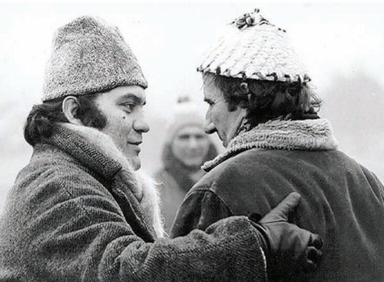
Са снимања филма „Тишине”, номинованог за „Оскара”