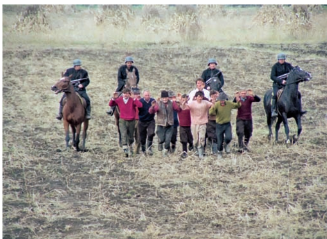
Кратки филм, „Смрт паора Ђурице“

је, можда, био и главни разлог што жири није доделио награду за најбољу селекцију, избегавајући на тај начин да се по трећи пут спомене име Југославије на завршној вечери 4. Фестивала“ (из књиге „70 година „Застава филма“).