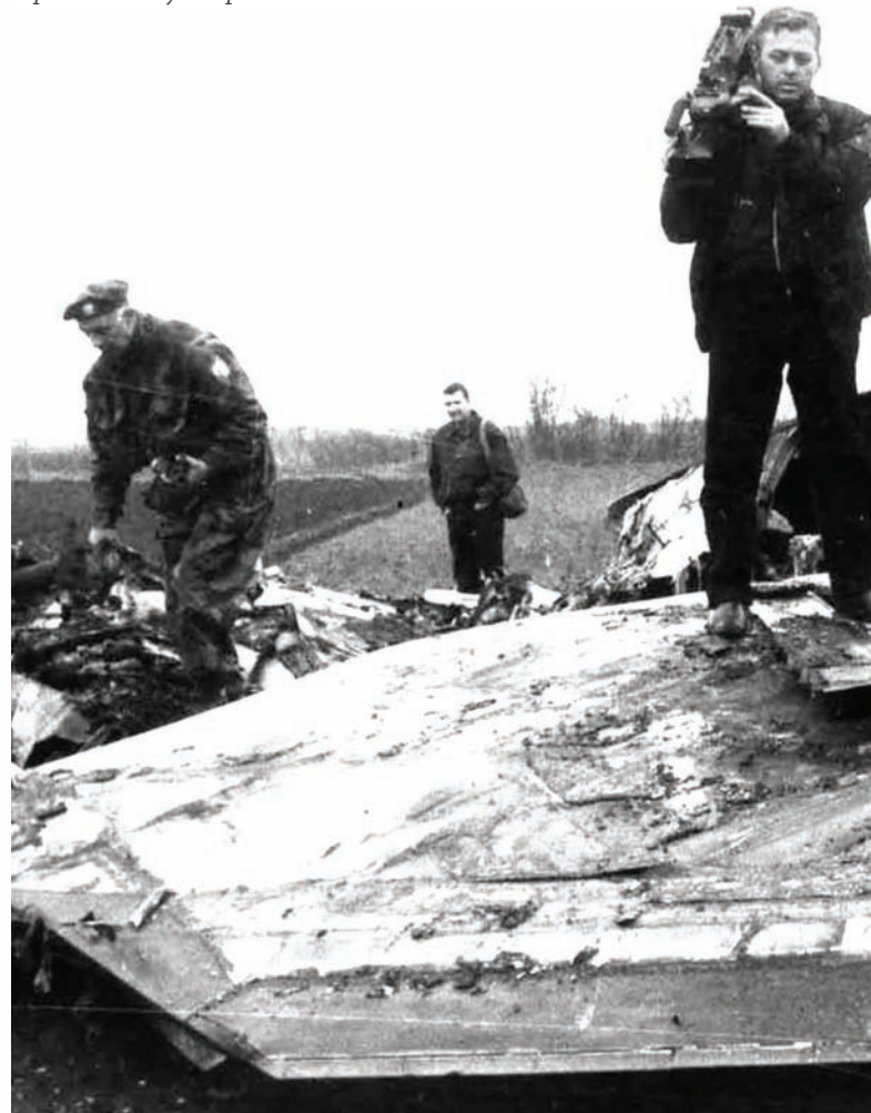
Први на месту обарања авиона F-117

Управа за морал Војске Југославије средином 1992. године покреће кампању с циљем креирања новог лика припадника Војске Југославије. Сви начини предста-